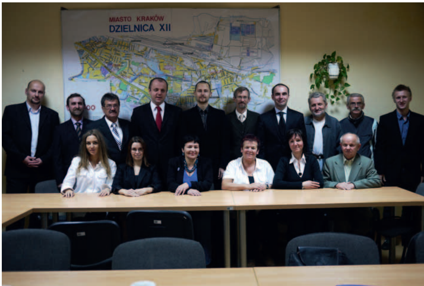
Radni Dzielnicy XII V kadencji 2006-2010.