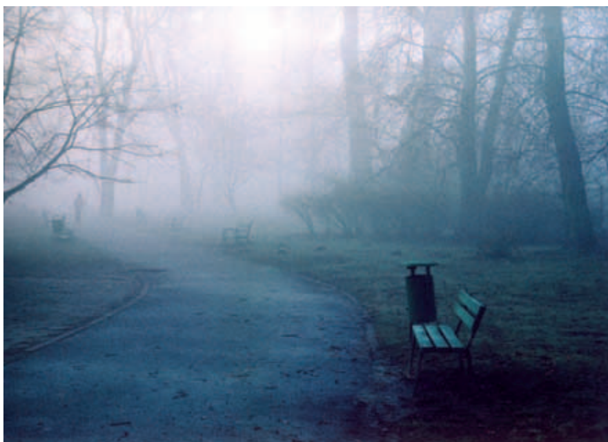
Park we mgle