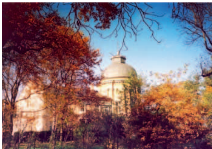
Park Jerzmanowski