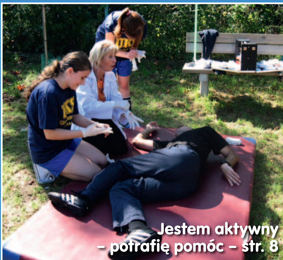
Jestem aktywny – potrafię pomóc – str. 8