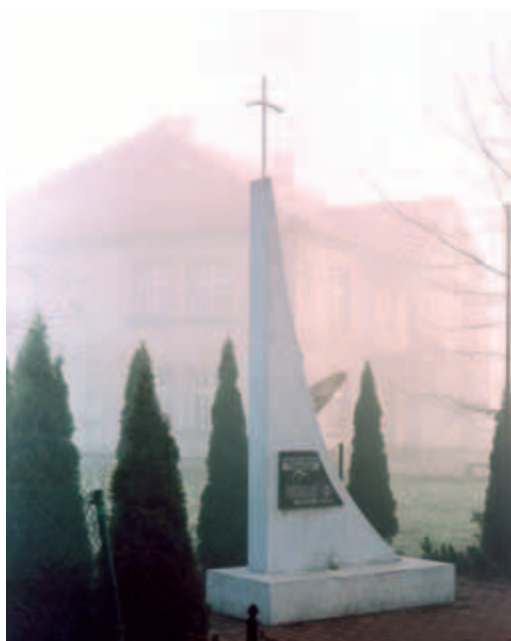
Park we mgle, fot. Maciej Hajdusianek