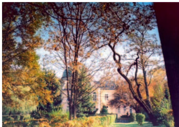
Park Jerzmanowski