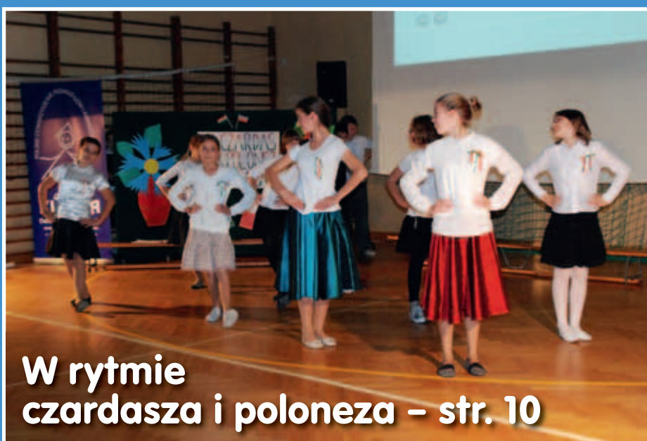
W rytmie czardasza i poloneza – str. 10

W Gimnazjum nr 32 na Żabiej dzieci się nie nudzą ..... str. 12